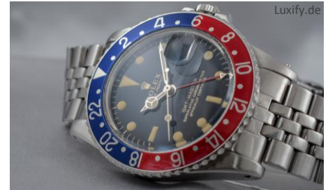
Rolex GMT-Master aus dem Jahr 1965

zu nehmen und diese den Experten vorzulegen. Beispielsweise kann eine alte Rolex GMT Master, aus den 70er Jahren bis zu 9.000 Euro erzielen. Selbst Bernstein genießt aufgrund hoher Nachfrage im fernen Osten seinen persönlichen Höhenflug. Oft sogar als „langweilig“ oder aus der Mode gekommen“ abgestempelt, könnte sich jetzt Bernsteinschmuck als große finanzielle Überraschung entpuppen. Für besonders schöne Honigbernsteinketten, im Idealfall in Oliven- oder Kugelform, kann man mit ein paar Hundert, bis zu mehreren Tausend Euro rechnen. Aufgrund der stark wachsenden Nachfrage aus dem Ausland hat sich der Preis für besonders schöne Schmuckstücke in den letzten 7 Jahren verzehnfacht. Daher lohnt es sich durchaus auch hier nachzuschauen, ob sich nicht eventuell noch etwas als Schatz entpuppt.